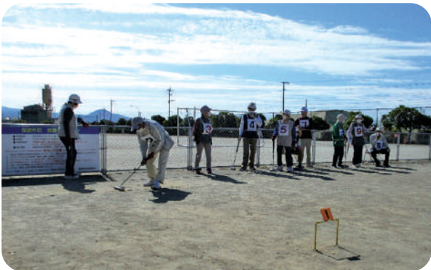
第1ゲート通過なるか?!日頃の腕前を発揮します! (10/11 開催 高齢者ゲートボール大会の様子)