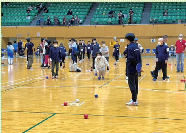
サロン同士の交流はもちろん、県内から出場した他チームとの交流を図ることができました。