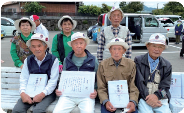
10/29に行われた郡老連ゲートボール大会で 準優勝した菅無田・法音寺寿会チーム

10月、まだまだ暑さが残るなか町老人クラブ連合会では多くの大会が開催されました。