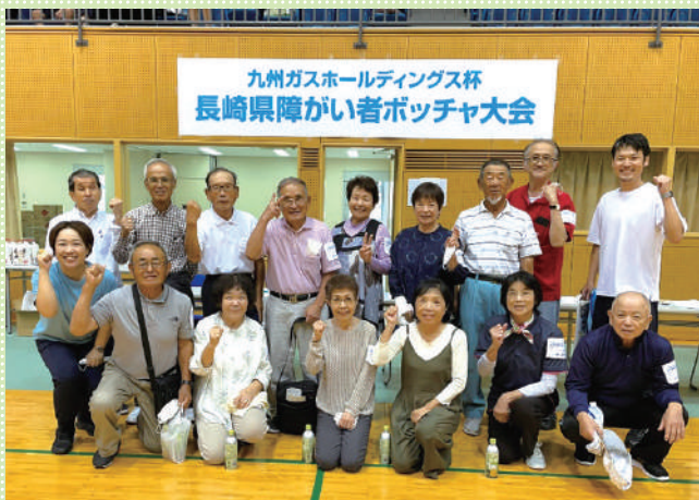
サロン連絡協役員12名が元気に参加しました! (会場: 諫早市中央体育館)

残念ながら決勝トーナメント進出とはなりませんでしたが、皆んなで御弁当を食べたり、帰りに鈴田峠で買物をしたりして、普段会うことの少ないサロン同士の交流になりました。また、大会を通してパラスポーツへの理解も深まり、大変有意義な研修になりました。