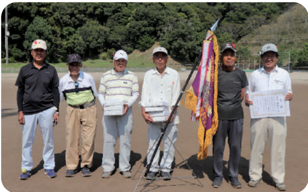
10/11に行われた郡老連グラウンド・ゴルフ大会で 優勝した駄地長寿会チーム